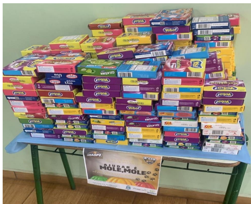
Gelatinas para Oncologia – Hospital Ministro Costa Cavalcante