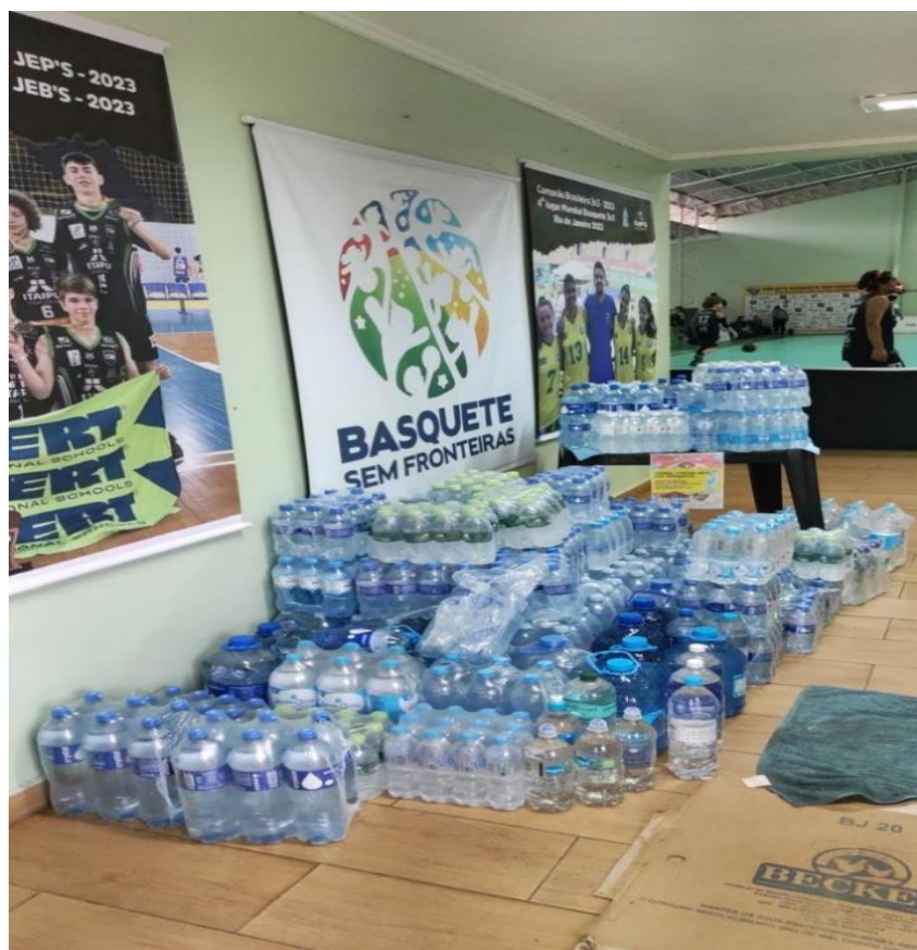
Doação de Água - Rio Grande do Sul