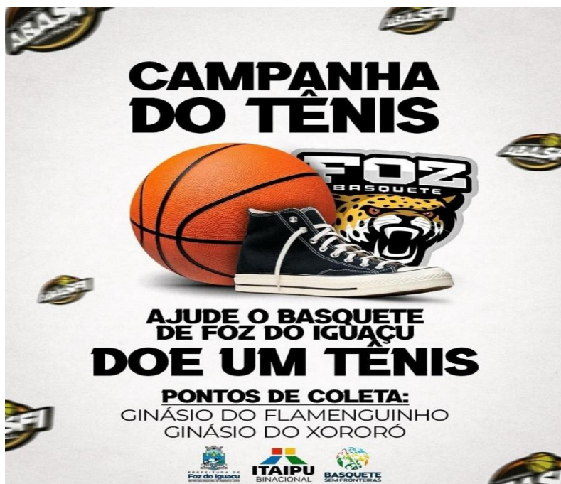
Campanha de tênis em prol dos nossos atletas