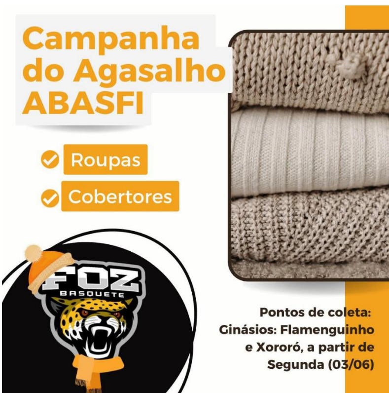
Campanha do agasalho em prol dos nossos atletas